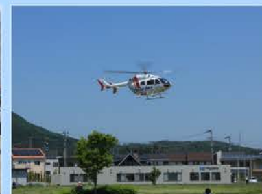
林野火災防ぎょ訓練

落成式、かわまちてらす閑上開業記念式典、町内会や各種団体の総会、第二中学校・増田西小学校の入学式に出席しました。 議員協議会において復興公営住宅の家賃などについて説明を受けたほか、掲揚が決められました。 5月 KPM増田川清掃に参加しました。総務消防常任委員会行政視察において、公文書管理などについて調査しました。 議員協議会において名取市第六次長期総合計画策定に係る課題等について説明を受けました。閑上地区まちびらき式典に出席、お浜降り神輿渡御に参加しました。 6月 みちのく潮風トレイル全線開通記念式典、青少年健全育成名取市民会議などに出席しました。増田西地区民レクリエーション大会に参加しました。