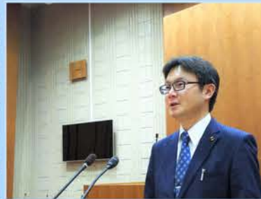
2月定例会 総括質疑