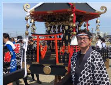
閑上地区まちびらき