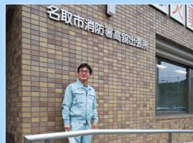
総務消防常任委員会現地調査

神話は現代につながるのか 出版記念研究発表会の案内 神話は現代につながるのか 出雲の祭器「琴板」をめぐる 期日…9月23日(月・秋分の日) 時間…14時開会(13時30分開場) 会場…増田公民館ホール 入場無料。駐車場は数に限り がございません。できるだけ公共交通をご利用ください。